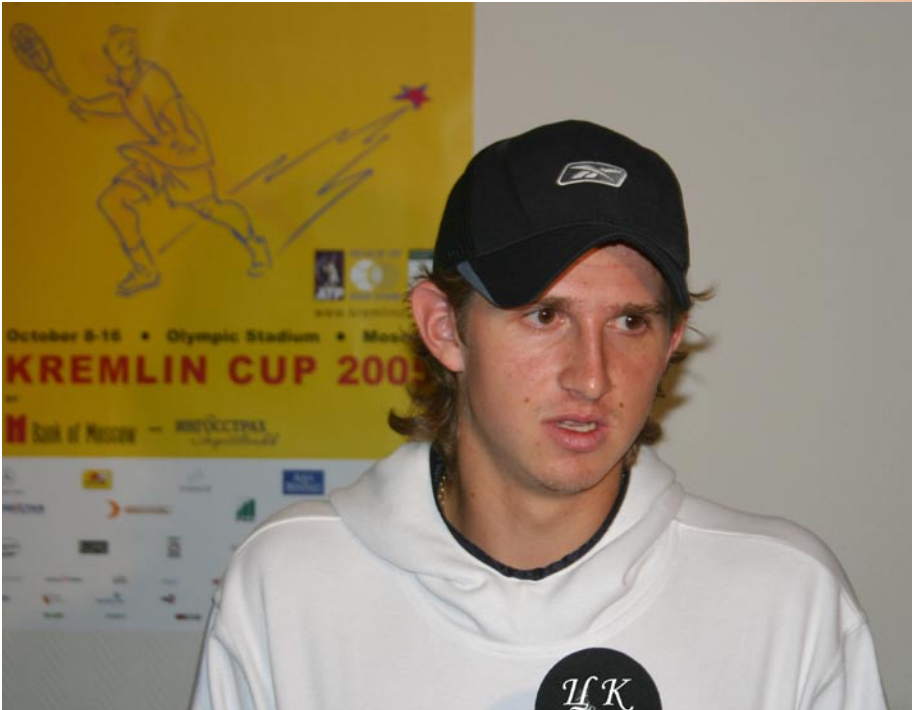
Так получилось сегодня, что сам "впутал" себя в такую сетку

Настя Мыскина. Хочется надеяться, что победа на слабом турнире в Индии повлияла на ее игровой тонус и повысила уверенность в своих силах. Сезон в залах Настя всегда играет очень уверенно и является действующей чемпионкой московского турнира, на котором всегда демонстрирует предельную собранность. Солидная поддержка трибун ей гарантирована даже в случае матча с Шараповой. Почему-то верится в успешное выступление Насти на Кубке Кремля и следующих турнирах этого года. Отсутствие травм - это плюс, однако, Кубок Федераций и затем три турнира подряд в очень отдаленных странах - это вряд ли очень удачный график и усталость может сказаться в любой момент.