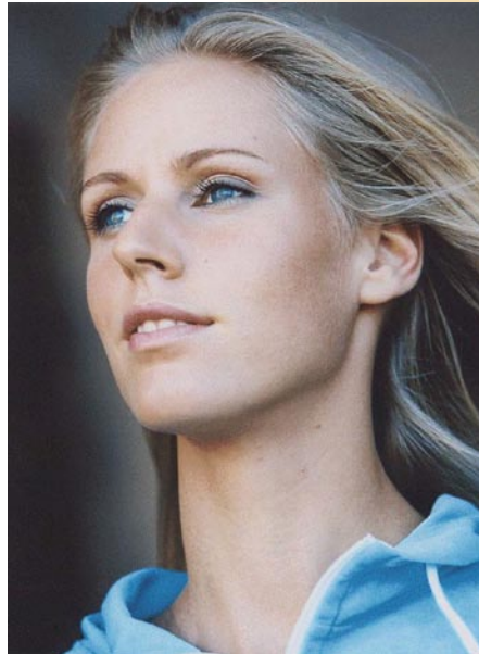
Беспокойная жизнь Елены Дементьевой : тренировка за тренировкой, с турнира на турнир , со съемок видеоклипа на съемки для стильного журнала

- Я уже неоднократно говорила, что всему, чего я добилась, я благодарна своей семье. В частности, своей маме, которая каждый день со мной: не только после каких-то ярких побед, но и когда у меня какие-то травмы, что-то не складывается. Я уверена, что я не смогла бы добиться успехов без неё, без