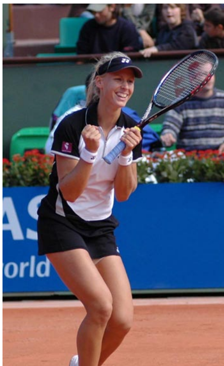
Ничто так не добавляет уверенности в собственных силах, как победа в тяжелой борьбе

специально для "Центрального корта" беседовала Вера Новикова