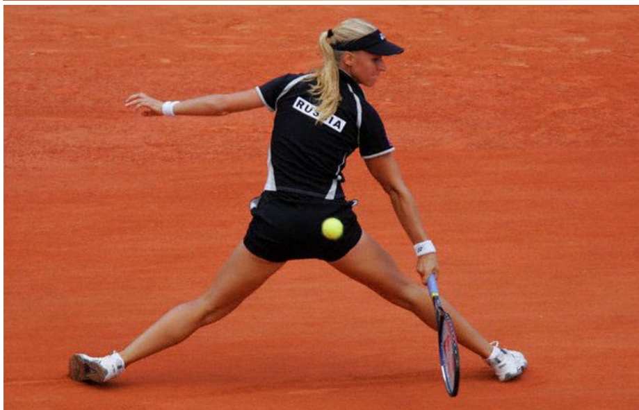
Белокурое торнадо открылось Парижу с новой стороны и смогло его покорить